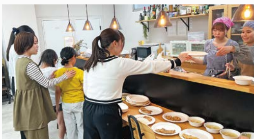
▶子ども食堂の様子

学生たちは今日も、北九州、さらには日本各地のまちで学び、成長を続けています。そのような歩みの先には、より良い地域社会の未来が築かれていくと信じています。私自身も学生らと真摯に向き合いながら、地域の課題解決に取り組んでいきたいと考えています。