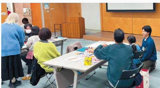
▶夏休み自由研究教室の様子