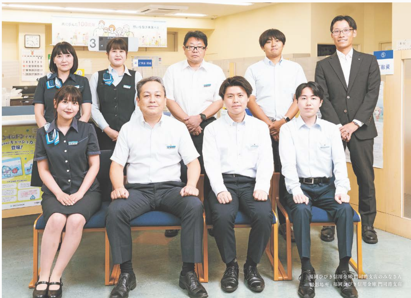
福岡ひびき信用金庫 門司港支店のみなさん 撮影場所：福岡ひびき信用金庫 門司港支店