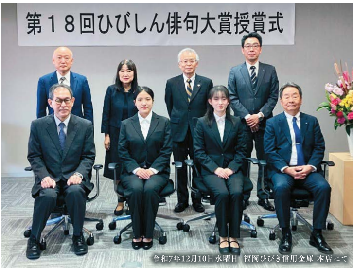
令和7年12月10日 水曜日 福岡ひびき信用金庫 本店にて