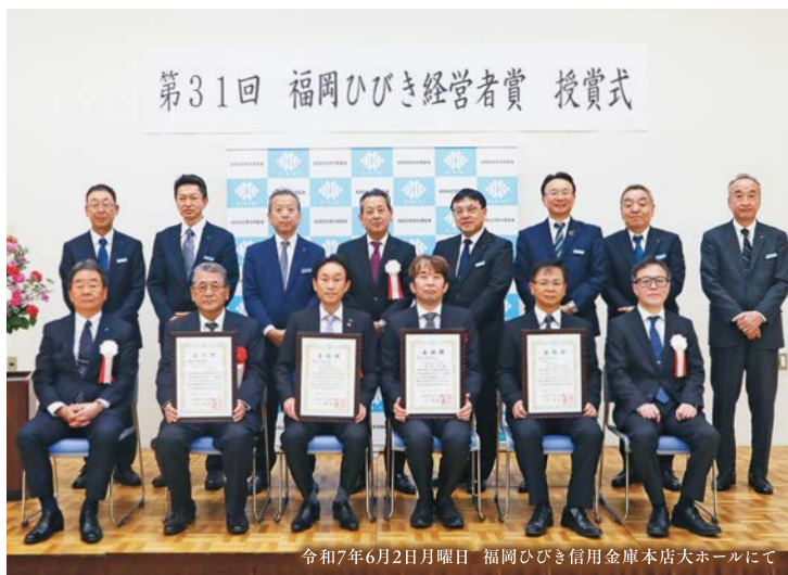
令和7年6月2日 曜日 福岡ひびき信用金庫本店大ホールにて