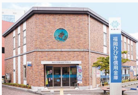
福岡ひびき信用金庫 門司港支店 支店長