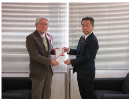
於:若松区社会福祉協議会