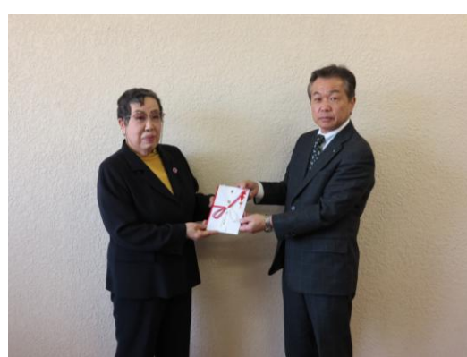
於:直方市社会福祉協議会