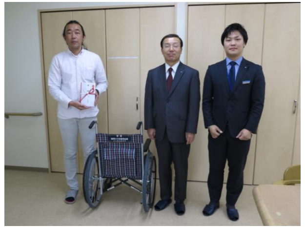
於:(有)おもやいの家様