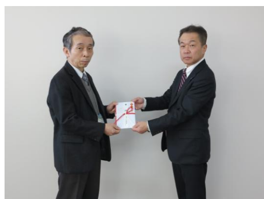
於:八幡西区社会福祉協議会