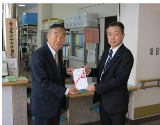
於:豊前市社会福祉協議会