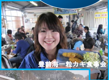
豊前海一粒カキ食事会