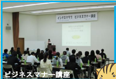
ビジネスマナー講座