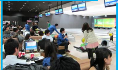
THEボウリング大会&大忘年会