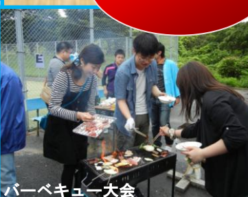
バーベキュー大会