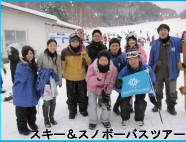
スキー&スノーボードツアー