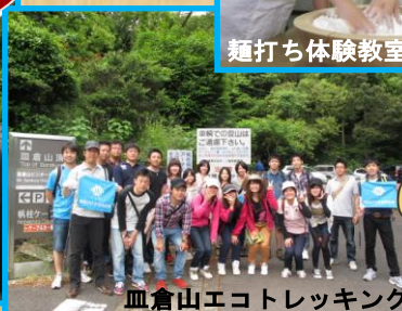
皿倉山エコトレッキング