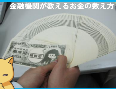
金融機関が教えるお金の教え方