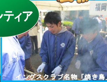
イングスクラブ名物「焼き鳥」