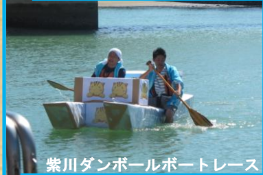
紫川ダンボールボートレース