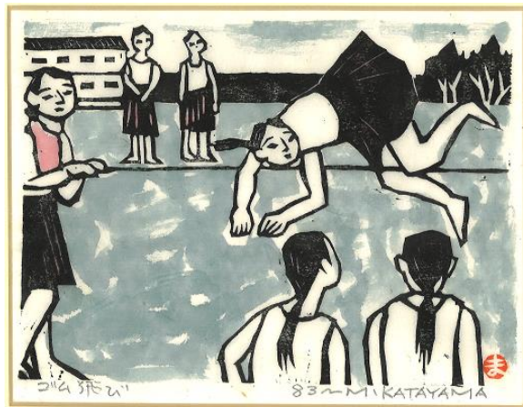
No. 36 ゴム跳び