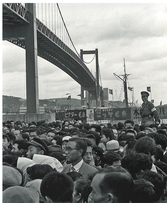
← 開通時の人だかり