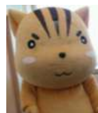
ひびしんのゆるキャラ 『ビッキー』